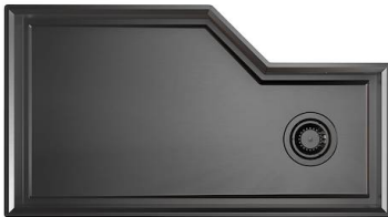
Lavello Diade Gun Metal 3028 006